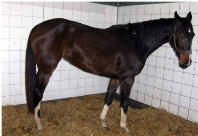
Pferd mit EIA.